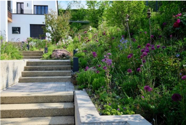
Wildblumensaum mit hohen Stauden als Wegbegleiter

Auch Funktionsflächen wie Wege – umgeben von üppiger Blütenpracht – bieten heimischen Tieren Unterschlupf und laden zum Schlendern ein. Am Wegesrand können hoch wachsende Stauden als Wildblumensaum gepflanzt oder gesät werden.