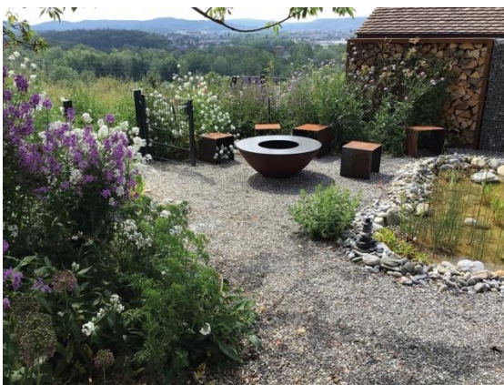
Harmonie zwischen Natur und Design

Naturgarten und stylish – passt das zusammen? Auf jeden Fall! Mit heimischen Wildpflanzen lassen sich sehr ästhetische Gärten gestalten. Das gilt auch für größere, professionell angelegte Flächen und Wohnanlagen. Dabei sind sie so gebaut, dass sie auch Tieren ein Zuhause bieten und die biologische Vielfalt stärken. Die Planung nachhaltiger Gärten richtet sich nach den Bedingungen vor Ort wie Boden, Licht und Niederschlag sowie den Wünschen der Nutzerinnen und Nutzer. Die Formen sind dabei zweitrangig. Ob eckige oder geschwungene Beete: Wichtig ist, dass die für den Standort geeigneten heimischen Wildpflanzen angesiedelt werden, die sich als Team über Jahre entwickeln können. Sie bieten Nahrung und Unterschlupf für unzählige Tiere.