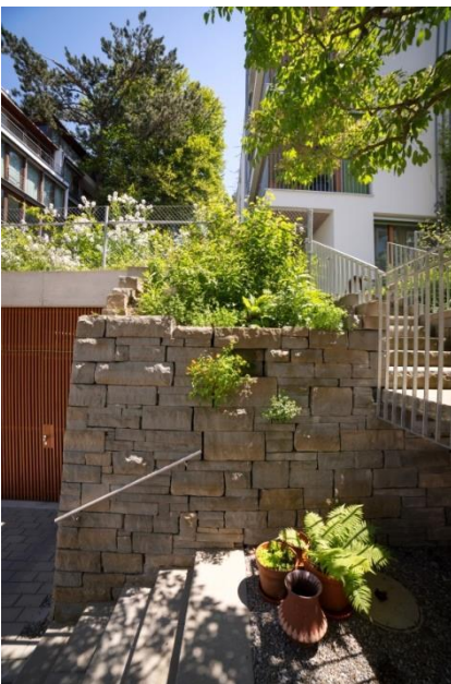
Trockenmauer mit Bepflanzung

Eine schöne Möglichkeit, den Garten in verschiedene Räume aufzuteilen oder Hänge abzufangen sind Trockenmauern . In ihren Ritzen fühlen sich Insekten oder auch Eidechsen wohl. Mit einer bequemen Höhe sind sie gleichzeitig natürliche Sitzgelegenheiten. Beim Bau kann man die passenden heimischen Wildpflanzen zur Begrünung direkt mit einlegen.